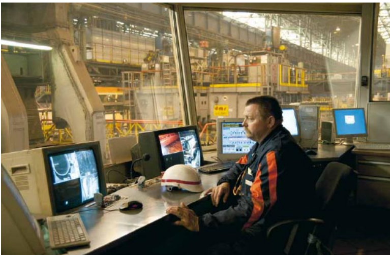
Claire Chevrier, GR 07 / 2010, tirage Lambda couleur, 50 x 80 cm.

l'APEI du Valenciennois et ses Établissements et Services d'Aide par le Travail (ESAT), le CRP, le Centre National des Arts Plastiques et le Musée Nicéphore Niepce, Chalon-Saône.