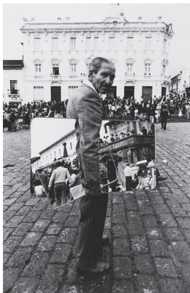
© Graciela Iturbide (1942-, Mexique), Señor de las imágenes , 1982, 26 x 17,6 cm, coll. artothèque du CRP.