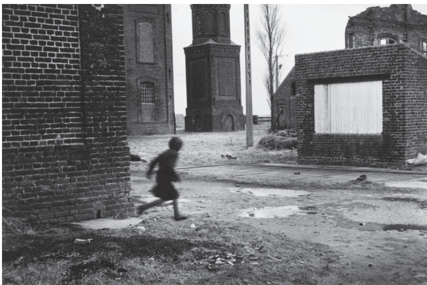
© Thierry Girard (1951-, France), Les Moères, Nord, 1985, 20,5 x 30,5 cm, coll. artothèque du CRP.

Renseignements et inscriptions: crp.contact@orange.fr / Tél. : 03 27 43 56 50