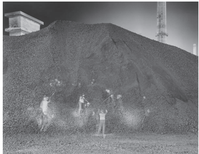
© Raffaella Mariniello (1961-, Italie), "Bagnoli, una fabbrica", Cokeria , Bagnolie (près de Naples), vers 1990, 55,9 x 43,7 cm, coll. artothèque du CRP.