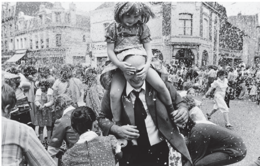
© Pascal Dolémieux (1953-, France), Le carnaval de Douai , 1979, 21,8 x 32,5 cm, coll. artothèque du CRP.