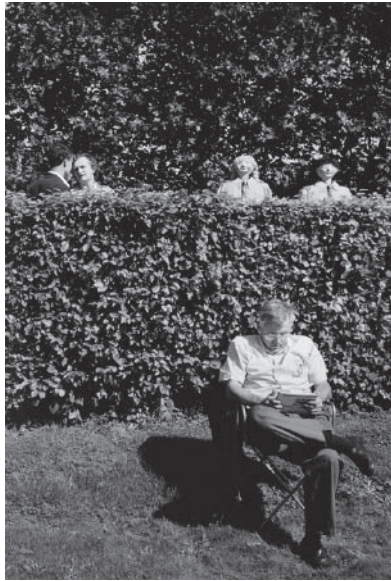
© Michel Vanden Eeckhoudt (1947-, Belgique), "Sur la ligne", Sans titre, commande Mission Photographique Transmanche n° 17, 1994, coll. CRP.

Contact crp.contact@orange.fr 03 27 43 56 50